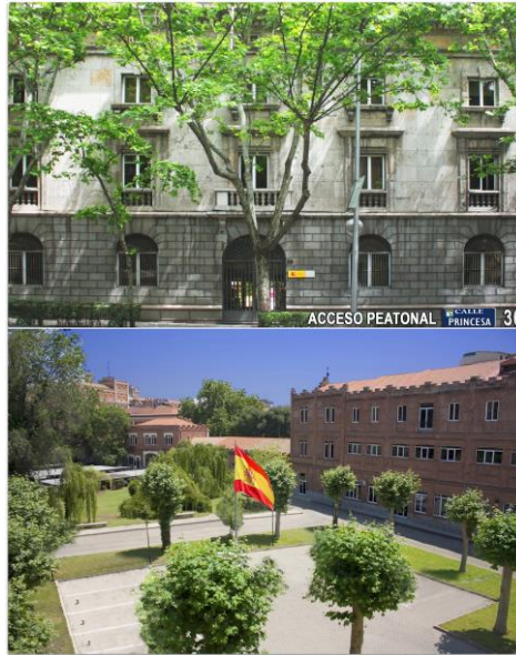
Instalaciones del Instituto Universitario General Gutiérrez Mellado de la UNED Calle Princesa, 36. D.P. 28008 Madrid Tel. secretaría: +34 91 7580011 info@igm.uned.es www.iugm.es