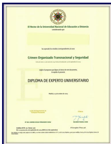
Diploma UNED de Experto Universitario en Crimen Organizado Transnacional y Seguridad