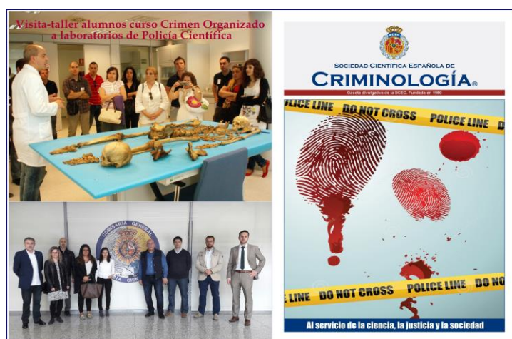
Visita-taller de alumnos al Anatómico Forense y a Policía Científica. Colabora en la actividad la Sociedad Científica Española de Criminología

Como en ediciones anteriores del curso, está previsto programar una visita/taller a organismos o instituciones de la lucha contra el crimen organizado y/o a la Comisaría General de Policía Científica. Esta actividad se llevará a cabo en colaboración con la Sociedad Científica Española de Criminología (SCEC), en su calidad de entidad colaboradora oficial por convenio con UNED. La visita/taller, de asistencia voluntaria, se realizará durante un día de abril de 2021, que se determinará convenientemente.